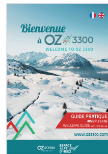
GUIDE DE BIENVENUE