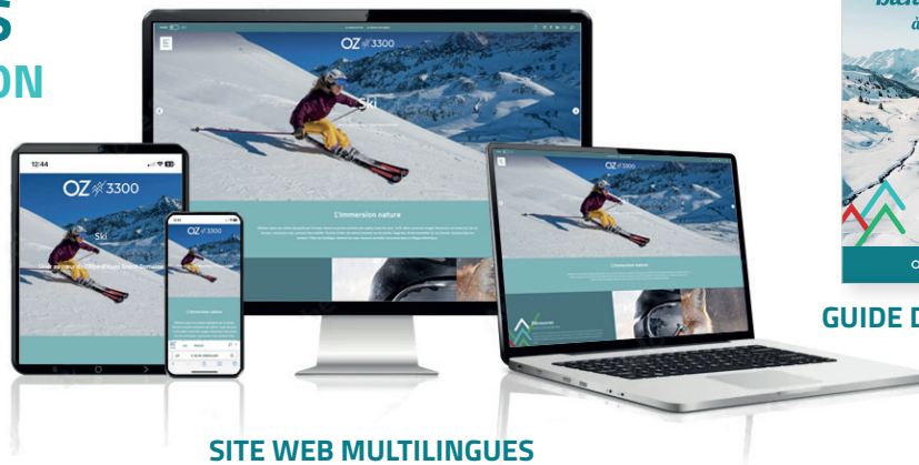
SITE WEB MULTILINGUES