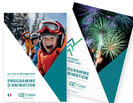
PROGRAMME D'ANIMATION BIMENSUEL